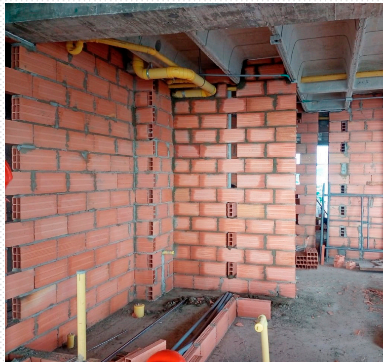
MAMPOSTERÍA PISO 14